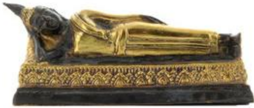
Bouddha du mardi

Posture couchée sur le côté droit, la main droite supportant la tête, la main gauche posée le long du corps, les deux pieds étendus à la même hauteur.