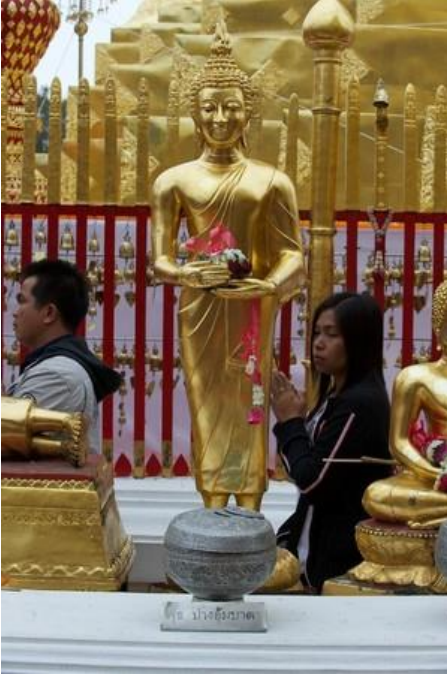
Procession devant les différents Bouddhas de la semaine à What Doi Suthep

Il y a un Bouddha par jour de la semaine, et chacune de ces représentations est liée à un acte de la vie de ce grand maître spirituel. Découvrez le Bouddha du jour de votre naissance!